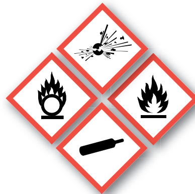
Sustancias explosivas e inflamables Explosive and flammable substances