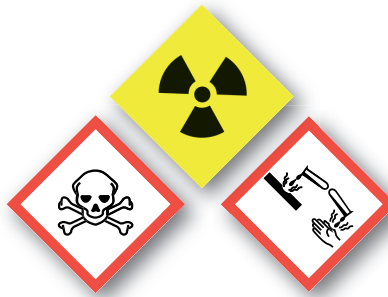
Sustancias químicas y tóxicas Chemical and toxic substances

Sólo se permiten Only the following items are allowed