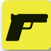
Armas de fuego Firearms