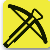
Otro tipo de armas Other weapons