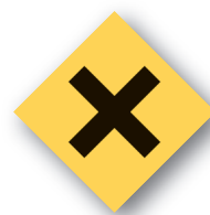
Artículos peligrosos Dangerous items