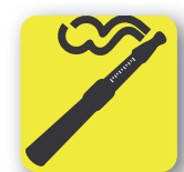
Cigarrillo electrónico Electronic cigarette

- La información contenida en este cartel está en total consonancia con la normativa europea en vigor, por la que se establecen medidas para la aplicación de las normas básicas comunes de seguridad aérea.