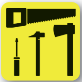
Herramientas utilizadas como armas punzantes o cortantes Tools used as stabbing or cutting weapons