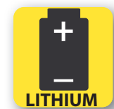
Baterías de litio fuera de los dispositivos electrónicos Lithium batteries outside electronic devices