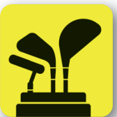
Objetos contundentes Blunt objects