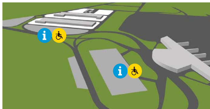
Accesos y aparcamiento